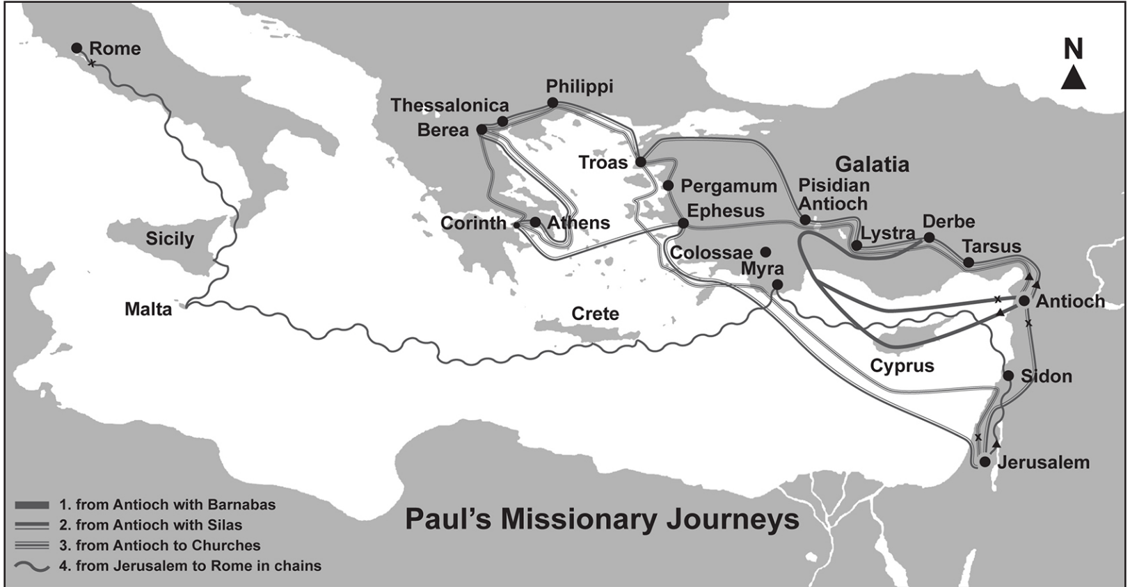
Pali, shërbëtor i Jezu Krishtit, i thirrur për të qenë apostull, i veçuar për ungjillin e Perëndisë, - Romakëve 1:1