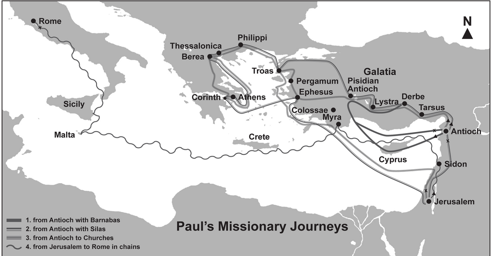
Paulus, Jesu Kristi Tjener, Apostel ifølge Kald, udtagen til at forkynde Guds Evangelium, - Romerne 1:1