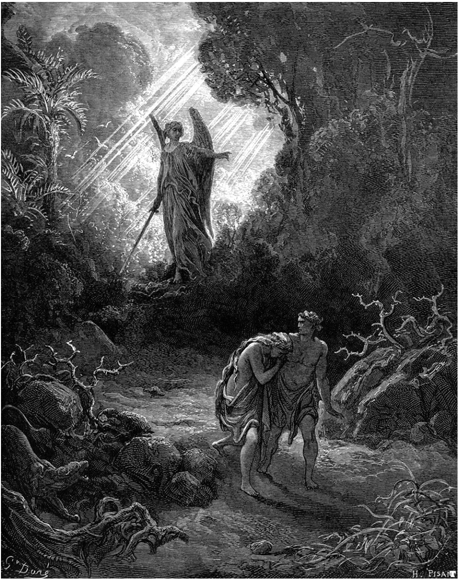
Il bannit Adam; il l'établit à l'opposé du paradis de délices, et il plaça des chérubins, armés d'épées flamboyantes qu'ils faisaient tournoyer, pour garder le chemin de l'arbre de vie. Genèse 3:24