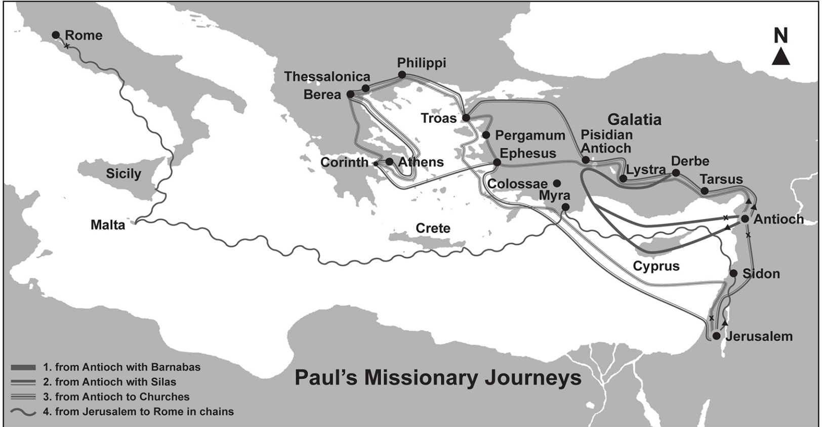
Paulus, Knecht Jesu Christi, berufener Apostel, ausgesondert zum Evangelium Gottes, - Roemers 1:1