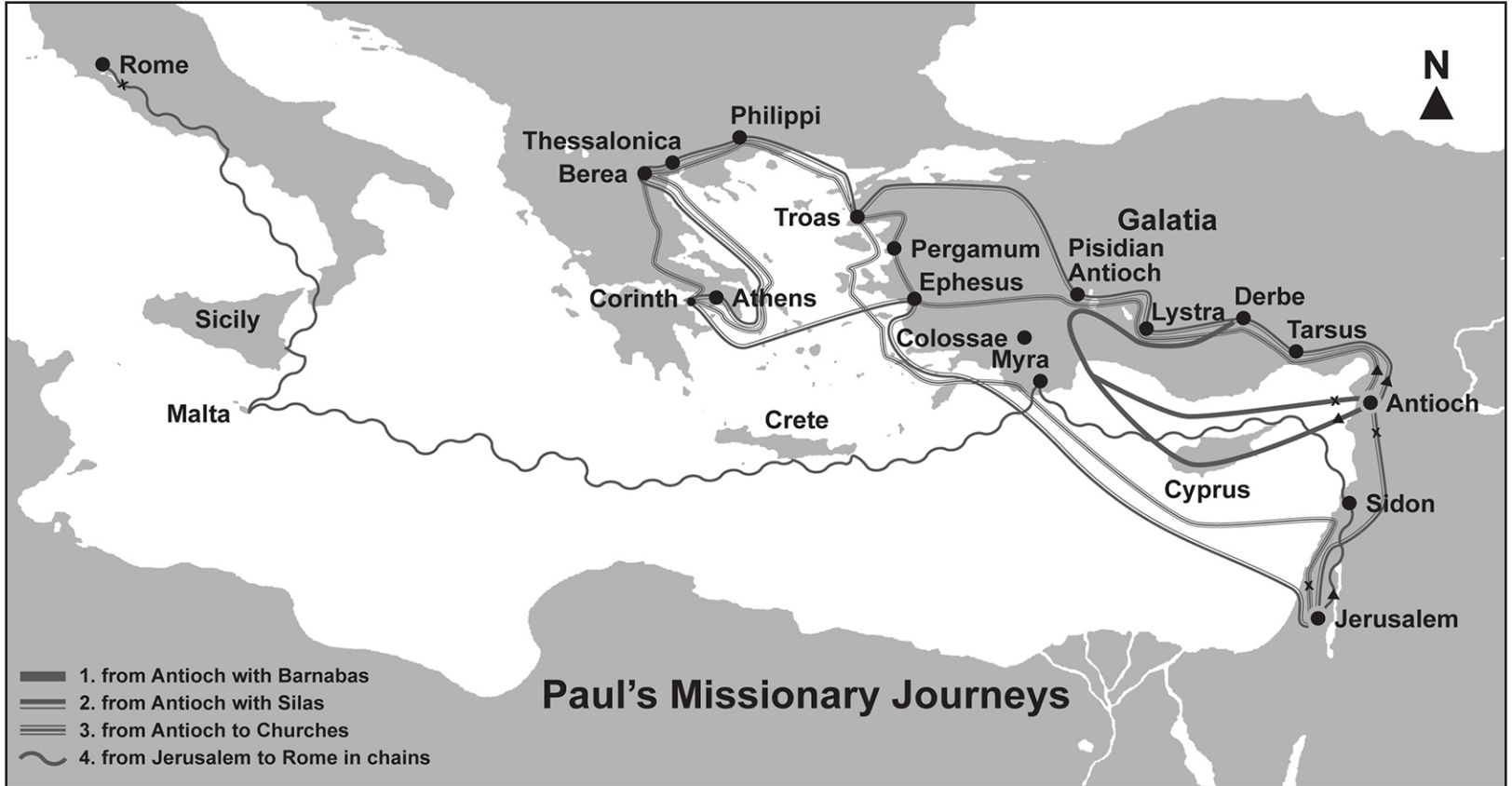
Paulo, servo de Jesus Christo, chamado para apostolo, separado para o evangelho de Deus, - Romanos 1:1