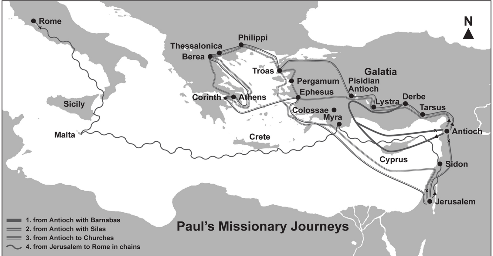
Paulo, mtumishi wa Yesu Kristo, aliyelitwa kuwa mtume, na kutengwa kwa ajili ya Injili ya Mungu. - Warumi 1:1